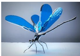
Embise & A. Moreau (en collaboration pour 2 œuvres)